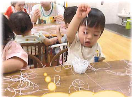
春雨の感触を楽しんでいます!