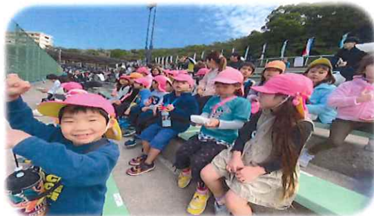
浦添市民球場に野球観戦をしました。 プロ選手の姿に釘付けです👀