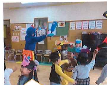
みんなで協力して 鬼退治をしたので、 福の神も来てくれました