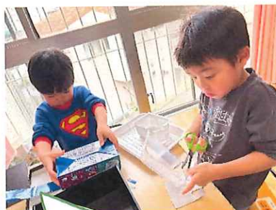
手先も器用になり、造形活動にも楽しんで取り組んでいます