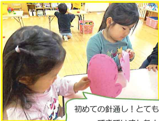
初めての針通し!とても上手にできていました☆