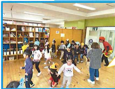
鬼の登場に泣いてしまう子もいましたが、がんばって鬼退治できました!