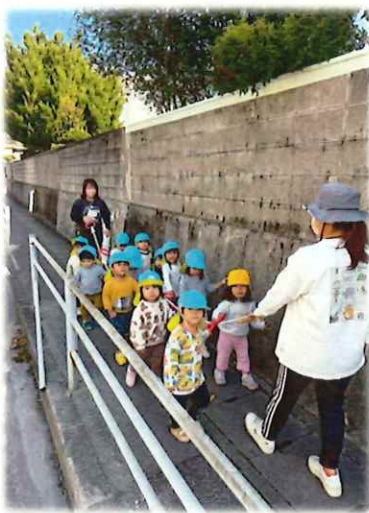
誘導ロープを使って初めての散歩に行ってきました!(^^)!