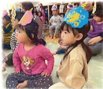
鬼のお面をつけて鬼は外～！福は内～！