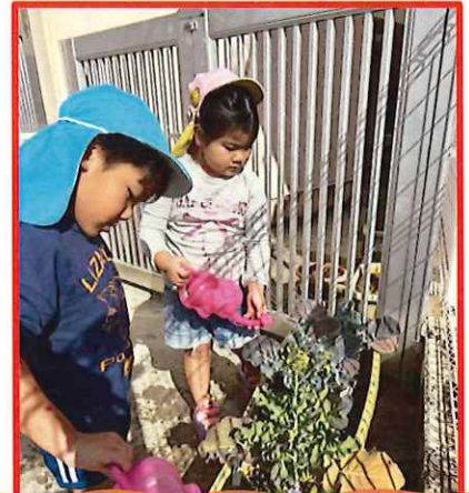
ブロッコリーも水やりも進んで行っています!毎日の生長が楽しみなようです♪