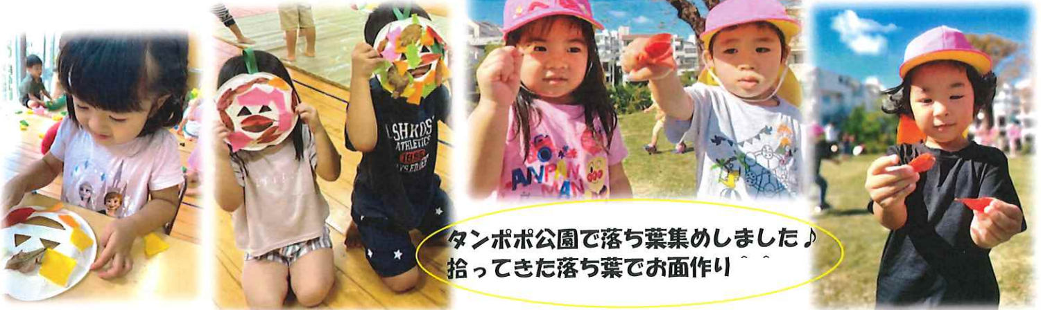
♪タンポポ公園で落ち葉集めました♪ 拾ってきた落ち葉でお面作り