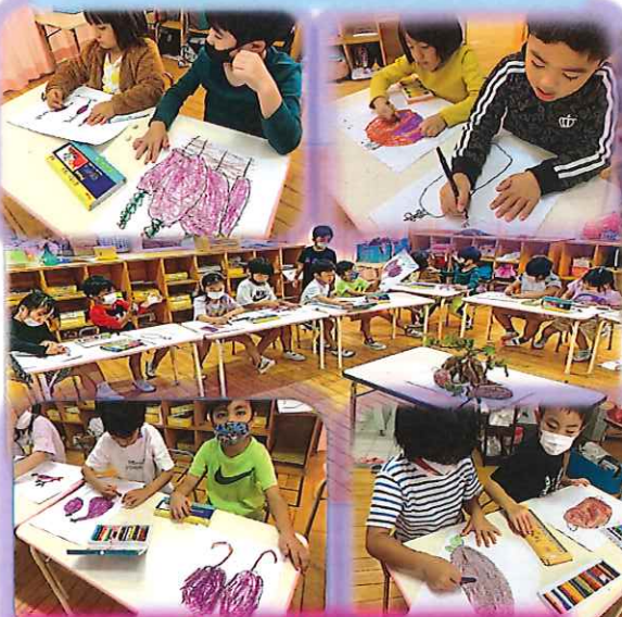
掘ってきた芋の絵を描いたよ★