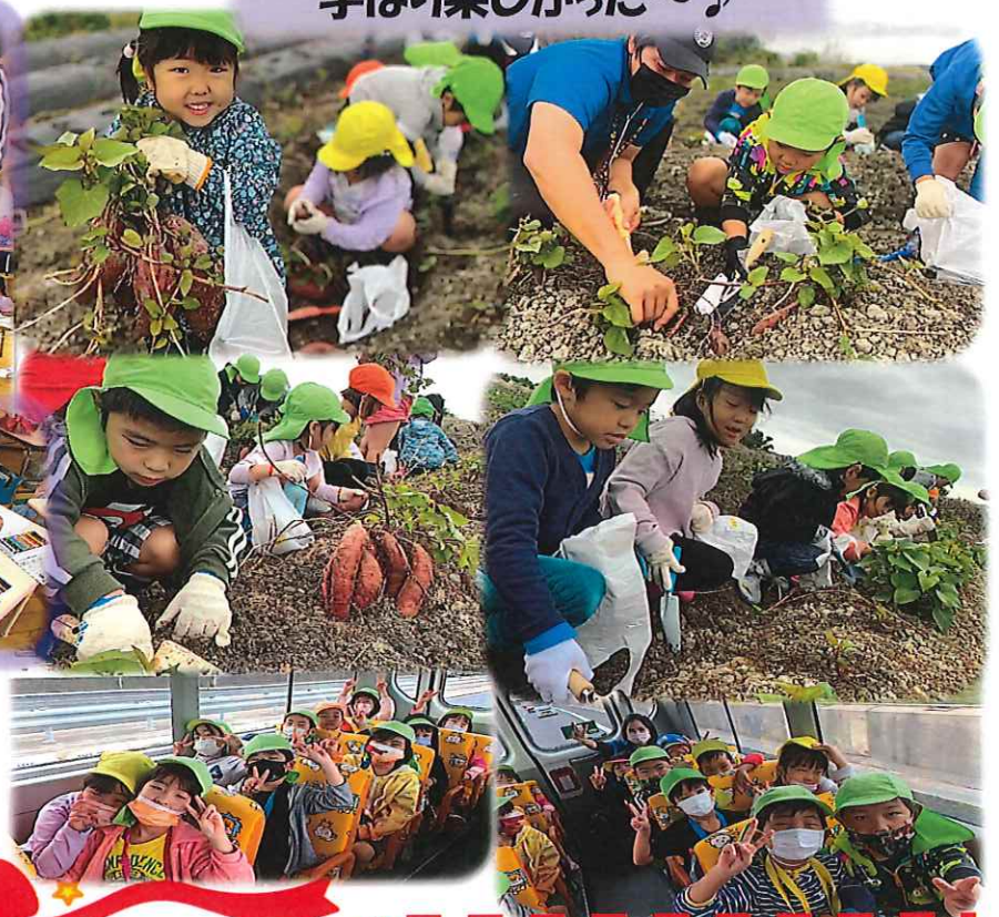
芋ほい楽しかった～♪