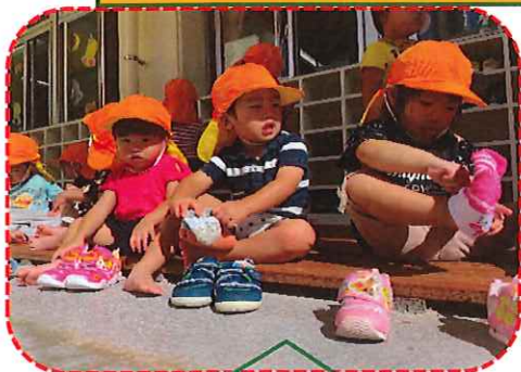
自分達で履いてみよう と頑張る子ども達♩