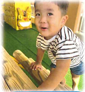
木の滑り台にも挑戦!