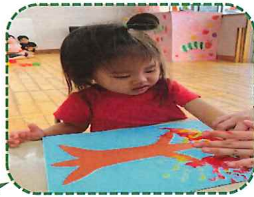
感触遊びを通して紅葉の木を製作中～!