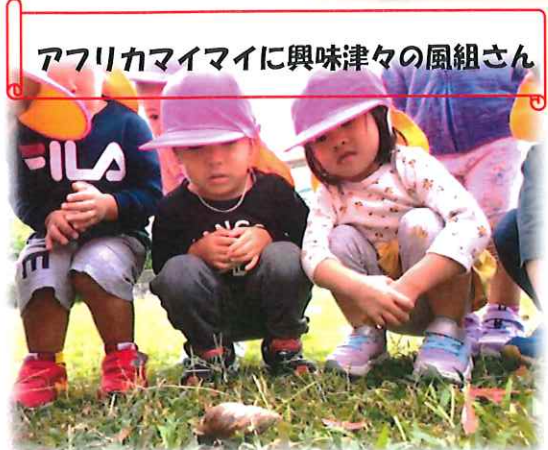
アフリカマイマイに興味津々の風組さん