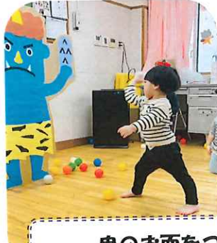
鬼のお面をつけて鬼は外～！福は内～！