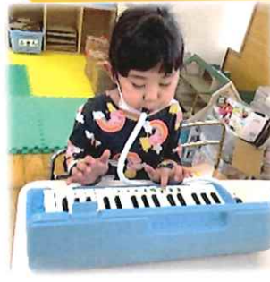
初めての鍵盤ハーモニカに挑戦中!