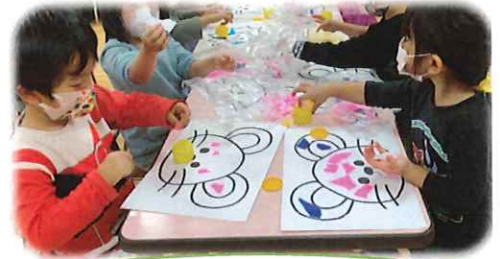
動物の絵でちぎり貼り♪