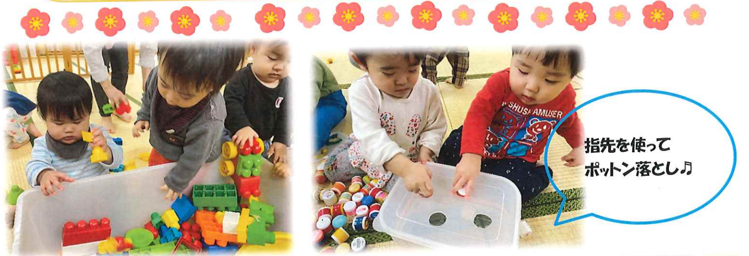
指先を使って ポットン落とし♪

あっという間に虹組クラスで過ごすのも残り1カ月になりました。進級に向けて次のクラスで過ごしてみたり、異年齢児や他の保育教諭などに関わったりしながら無理なく進級できるようにします。