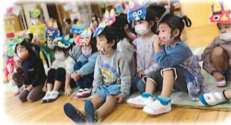
おにはそと〜ふくはうち〜!