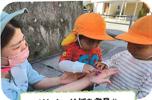
パトカーや桜を発見