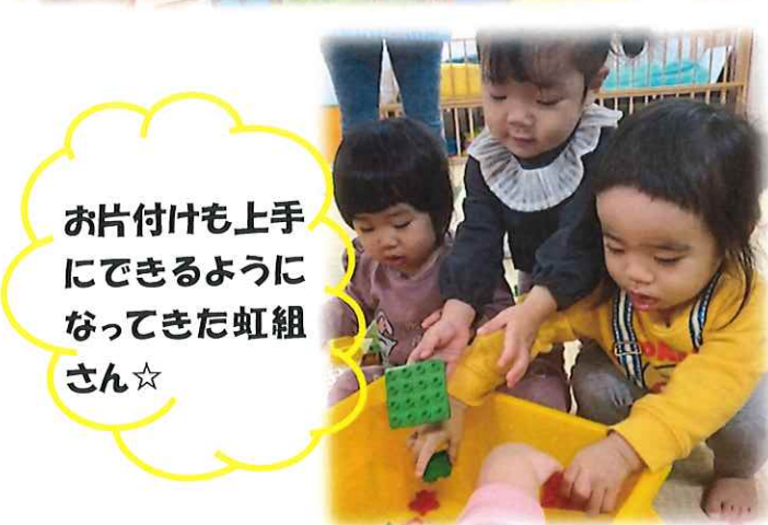
お片付けも上手に できるようになってきた虹組 さん☆