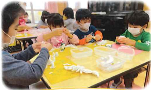
粘土遊びに夢中な子どもたち!