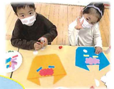
豆まき会ではみんなで力を 合わせて鬼をやっつけました!