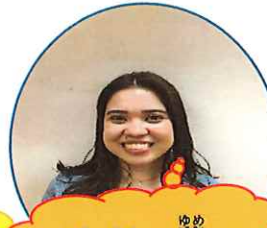
ダービー ゆめ ダービー 夢