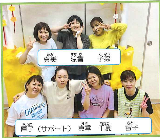
まみ 真美 すずか 涼香 こなつ 子捺