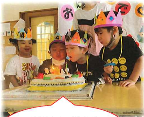
6月生まれの誕生会 せーのーで「ふ〜」

苦手そうなものでも食べてみるとおいしさに気づいたり、苦手な物でも、「先生見てね〜」と食べてみようとする子の姿があります。絵本などを通して苦手な物でも食べてみたり、食事をする事の大切さを伝えていきます。