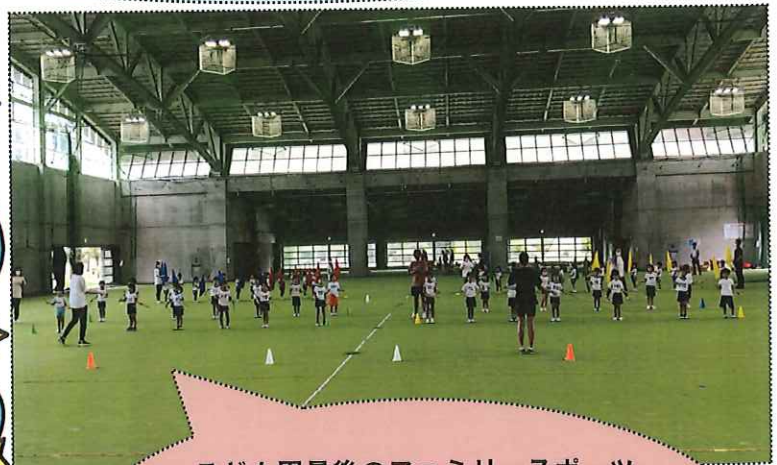
こども園最後のファミリースポーツデー!毎日、練習頑張っています!!