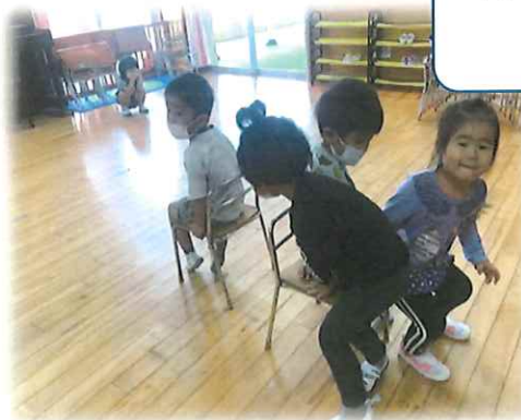
アイス取りゲームが大好きな輝組さん♡ 1位を目指して楽しんでいます