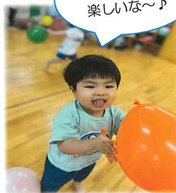
風船遊び 楽しいな〜♪