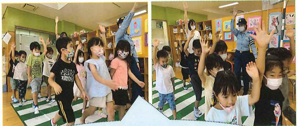
警察署の方が来てくれて、交通安全指導を受けました!「交通安全はみんなの願い!」