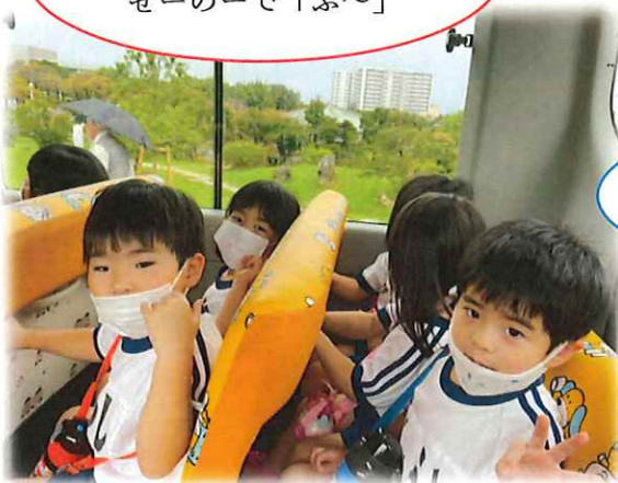
ファミリースポーツデーのリハーサルで 現地まで初めての園バスに乗りました♪