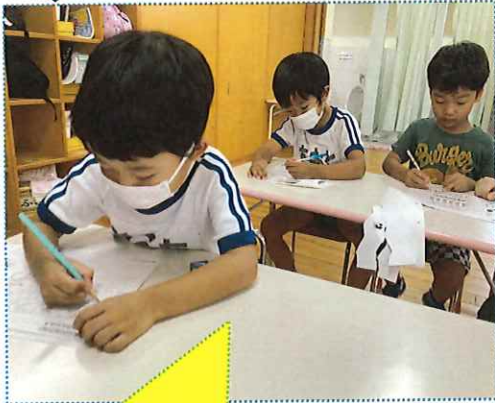
毎日、朝の会の前に学研や個別課題をしています。