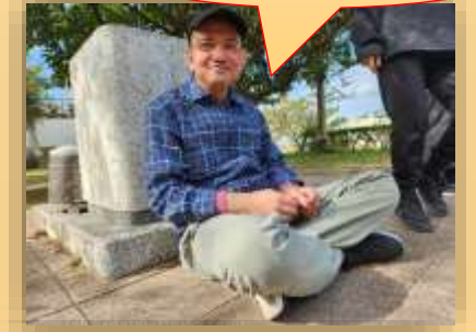
休憩はココが一番!!