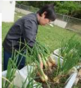
大きいの取れたよ!!