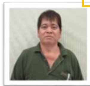
4月から入職しました