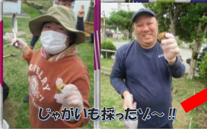
じゃがいも採ったよ~!!

園庭の畑で季節の野菜を育て、収穫・調理工程の一部を経験し普段食べている食材への興味を持ってもらおうと食育学習を行いました。今回は、ジャガイモ、タマネギ、ニンジン収穫しカレーライスに美味しく頂きました!(^^)!