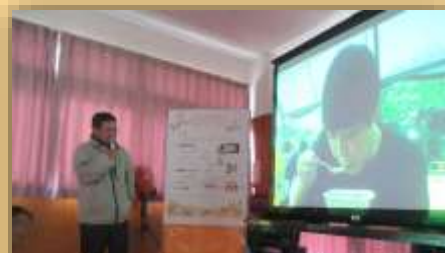
スライドショーでの1年の振り返り