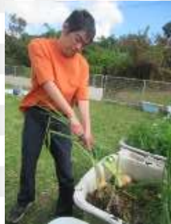
うんとこしょ、どっこいしょ