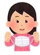
マスクのはずし方

マスクの表面にウイルスなどの飛散物が付着している可能性があります。耳にかけるゴムの部分を持ってはずします。