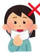
マスクの外側を頻繁に手で触る