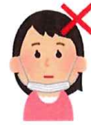
着用したマスクを顎にかける

ブリーツを上下にひらき、マスクを広げる。顔にあて、ノーズフィッター部分が鼻筋にフィットしたら、顔にフィットさせながら耳かけゴムを耳にかける。