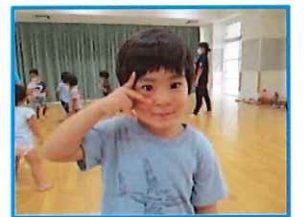
みんな一緒に嬉しいね!