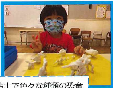
粘土で色々な種類の恐竜を作っています！