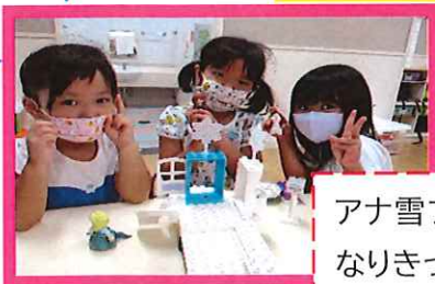
アナ雪ブロックで友だちとなりきって遊んでいます♪