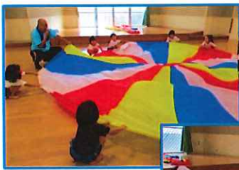
体育遊びで バルーンに 初挑戦!!

苦手な食材も自ら食べてみよう挑戦し「たべられたよ！」と嬉しそうに話しています。食べ物には、旬があることを知らせ、季節ならではの野菜や果物に興味を持てるようにします。