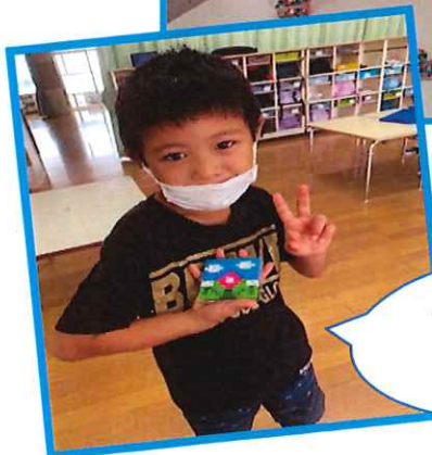
ビーズでお花を作ったよ🌸