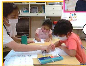
☆毎日の勉強も 始まりました!