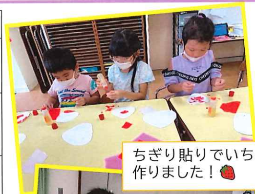
ちぎり貼りでいちごを作りました！🍓