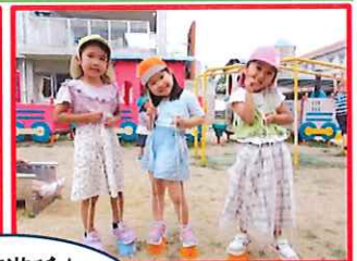
☆園庭遊び☆ 遊具やぼつくりを 楽しんでいます♪