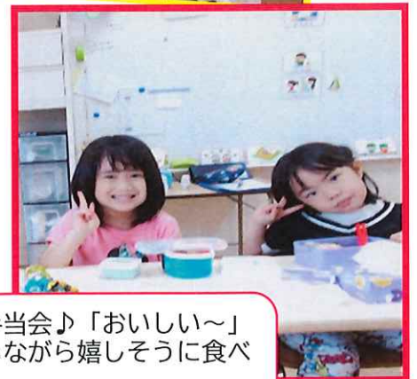
毎月楽しみのお弁当会♪「おいしい～」と友だちと見せ合いながら嬉しそうに食べています😊 お弁当作りもありがとうございます！