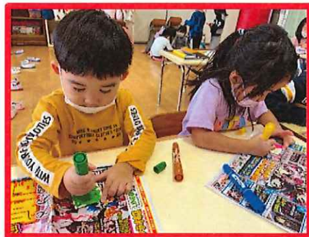
正月遊びでコマづくりをしました😊 好きな色を塗ってカラフルなコマができました。自分で作ったコマで嬉しそうに遊んでいました♪