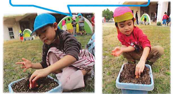
チューリップの球根を植えました！