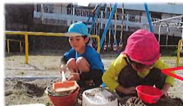
砂の感触にも慣れ、穴を掘ったり、ご飯を作ったりと楽しんでいましたよ☆