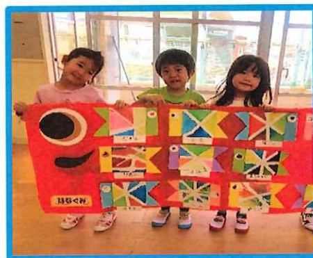
製作遊びでは、絵の具とマスキングテープを使ってこいのぼりを作りました★