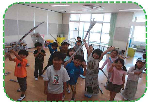
新聞遊びで剣やほうきやドレスを作りました♡